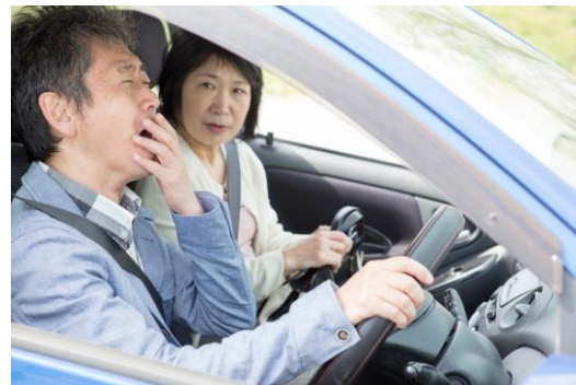
図1 睡眠時間による事故発生率